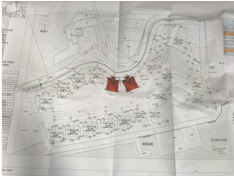
195 ada 7 parsel vaziyet planı (Avan Proje)